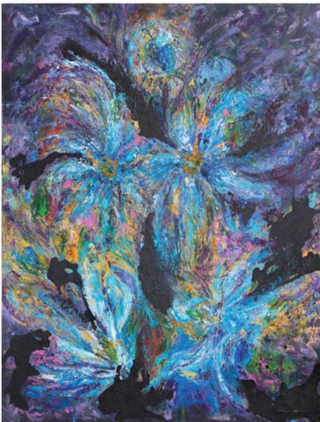
تکنیک رنگ روغن | ابعاد ۱۳۰x۱۰۰