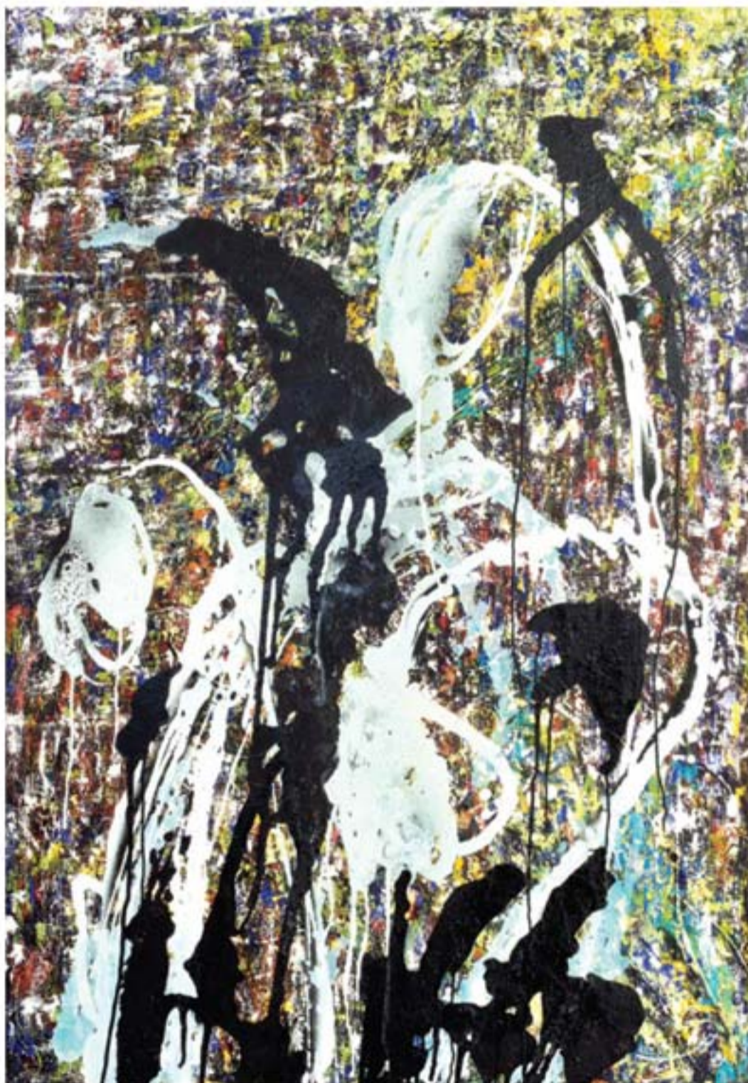
تکنیک هیکس مدیا | ابعاد ۹۰ x ۱۳۰