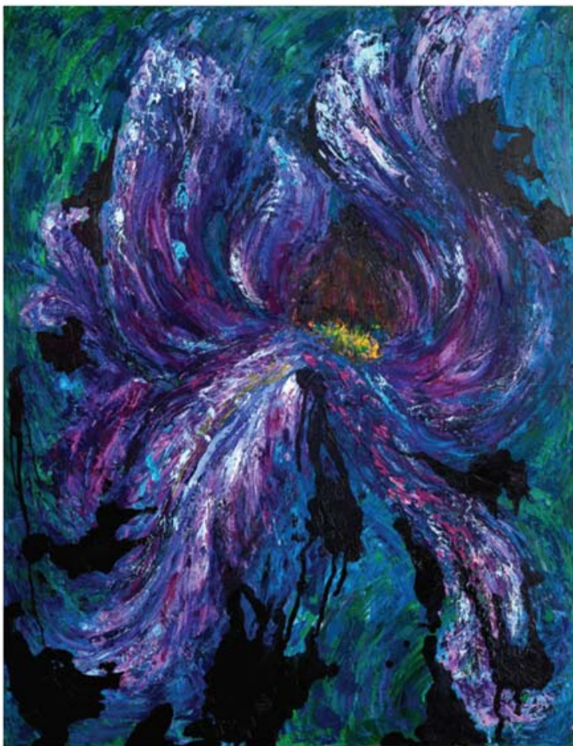
تکنیک رنگ روغن | ابعاد ۱۳۰ x ۱۰۰