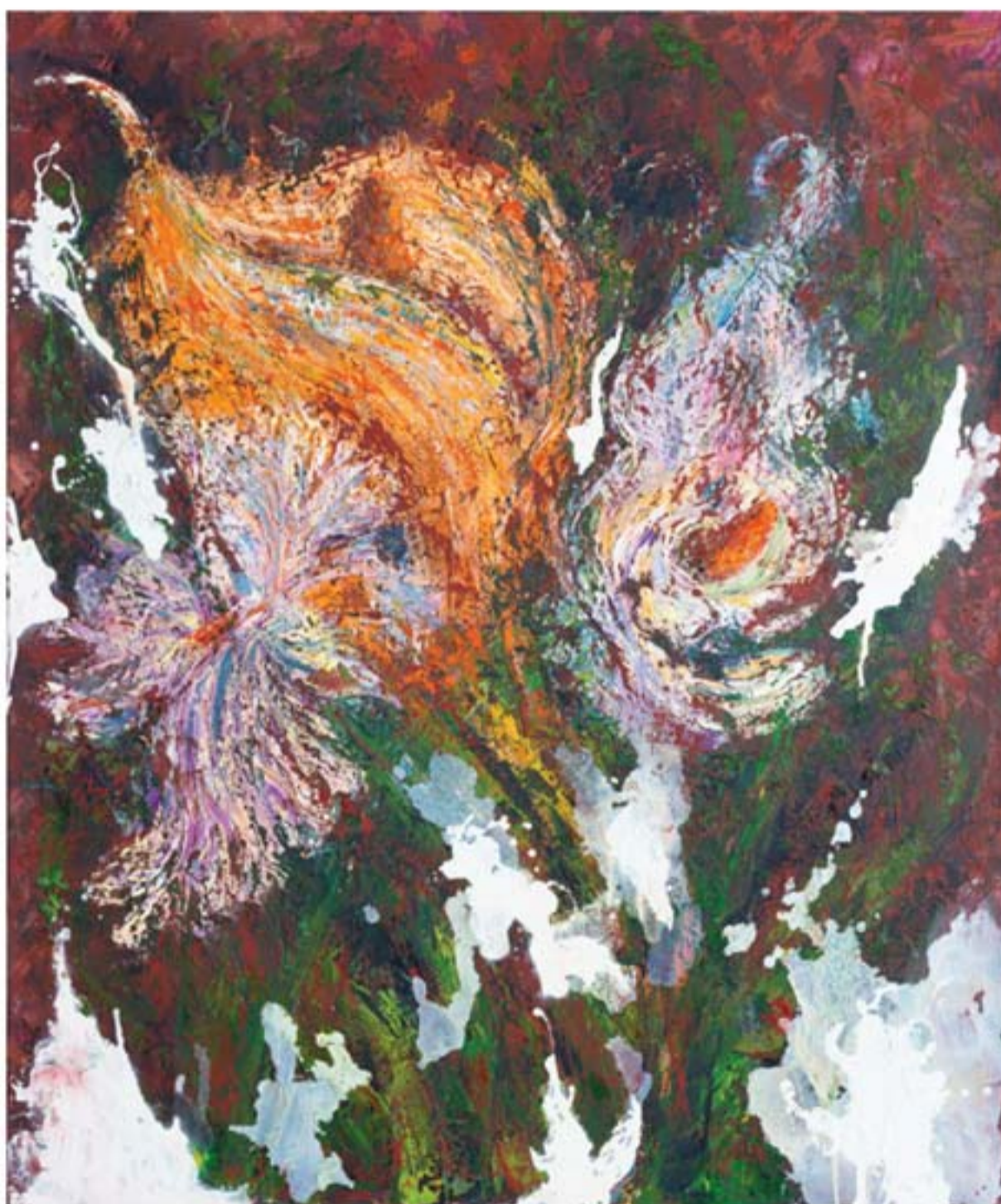
تکنیک رنگ روغن | ابعاد ۱۲۰ x ۱۰۰