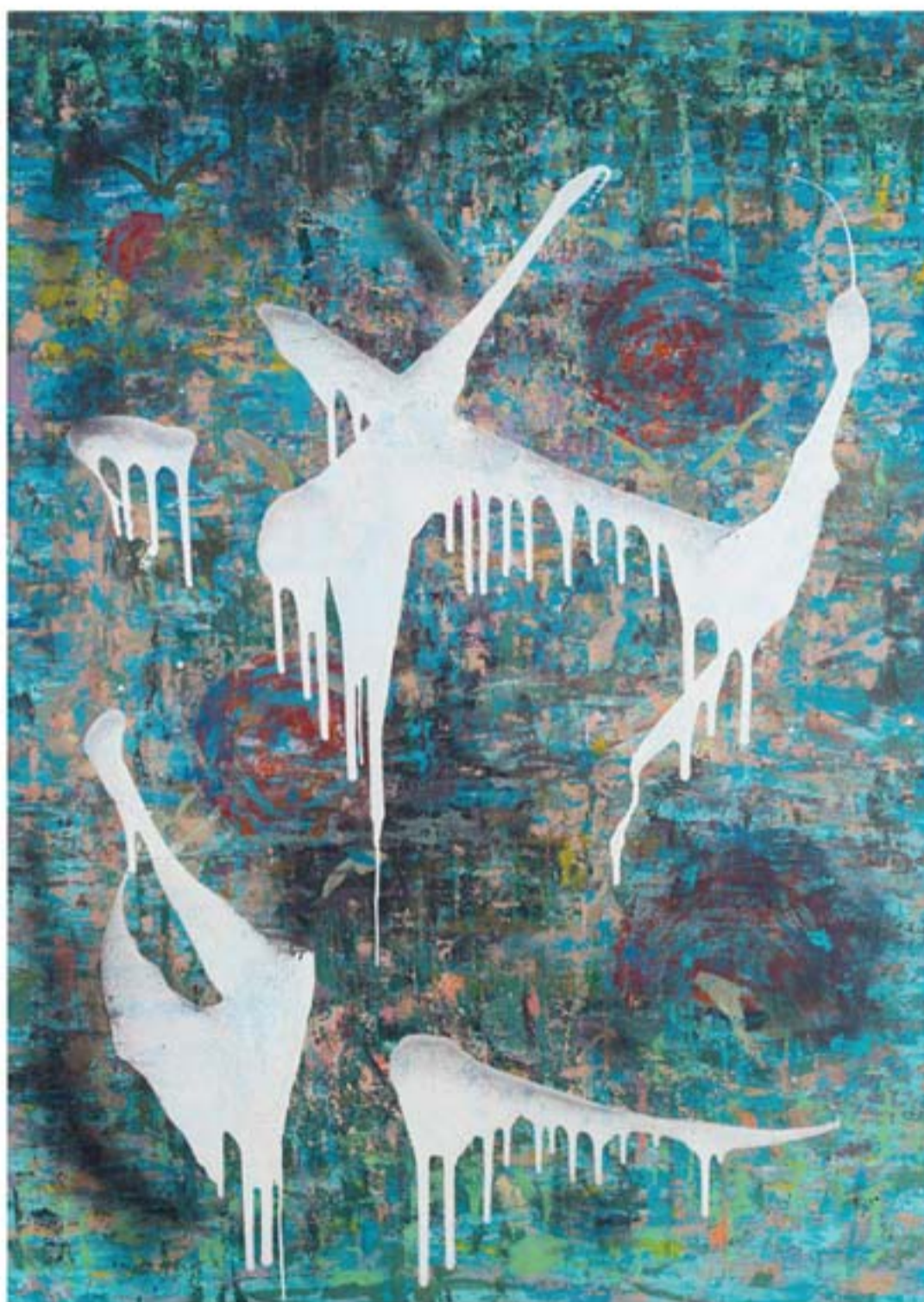
تکنیک میکس مدیا | ابعاد ۱۴۰ x ۱۰۰