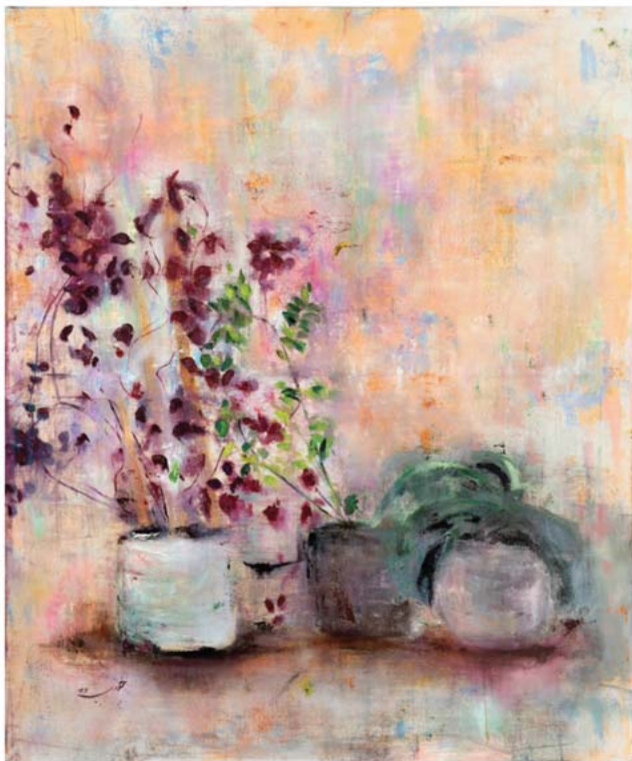
تکنیک رنگ روغن | ابعاد ۱۲۰ x ۱۰۰