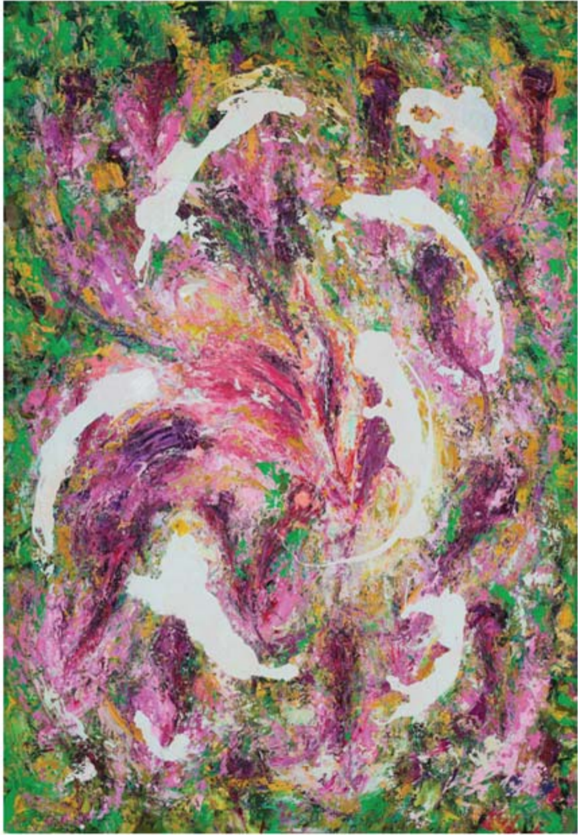
تکنیک رنگ روغن | ابعاد ۱۴۵ x ۱۰۰