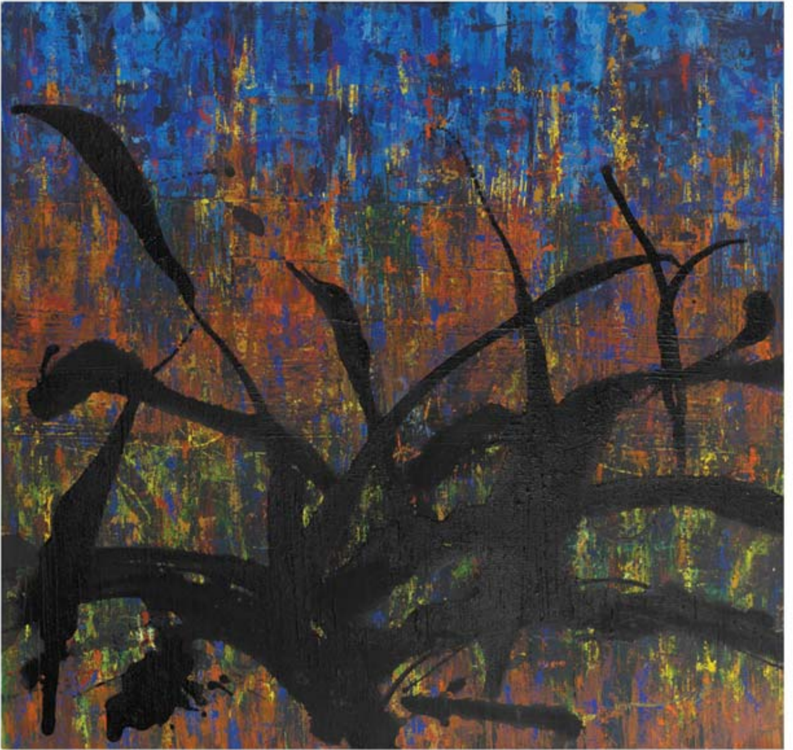
تکنیک میکس مدیا | ابعاد ۱۰۵x۱۰۰